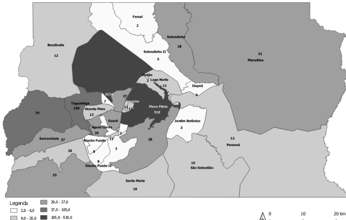
Número de pessoas ocupadas por local do trabalho principal -Regiões administrativas Distrito Federal - Mil pessoas - 2018

De maneira geral, observa-se um território dividido entre poucas regiões produtoras e muitas regiões consumidoras. Entre os aspectos analisados, encontrou-se alta concentração das ocupações em poucas RAs, identificando o Plano Piloto como a principal geradora de ocupações, seguido das RAs Taguatinga e Ceilândia.